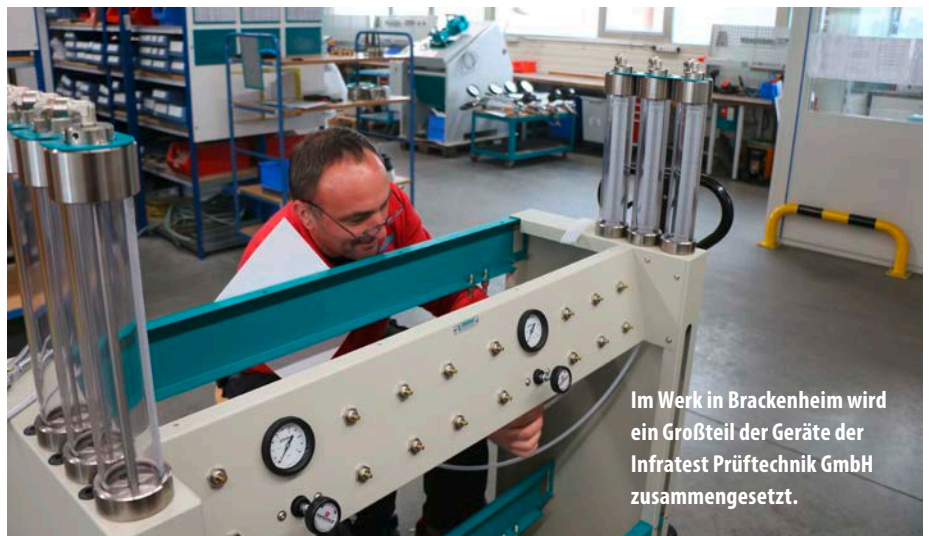
Im Werk in Brackenheim wird ein Großteil der Geräte der Infratest Prüftechnik GmbH zusammengesetzt.

Dass sich das Unternehmen auch in schwierigen Märkten behaupten kann, zeugt von dem großen Vertrauen seiner Kunden – und das mittlerweile seit 25 Jahren. 2017 wird Jubiläum in der Zentrale in Brackenheim gefeiert. Vom 21. bis 23. März präsentiert Infratest interessierten Kunden einen Querschnitt des Portfolios. Zusätzlich dazu verspricht die Enthüllung einer Weltneuheit einiges an Spannung. „Wir freuen uns auf unseren Geburtstag und darauf ein paar schöne Stunden mit unseren Partner verbringen zu können“, fasst Martus zusammen. Mehr Informationen hierzu finden Sie unter (Telefon oder Internet oder Mail). Hin